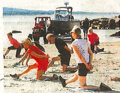
Viktigt att mjuka upp kroppen innan ett fläsigt pass.